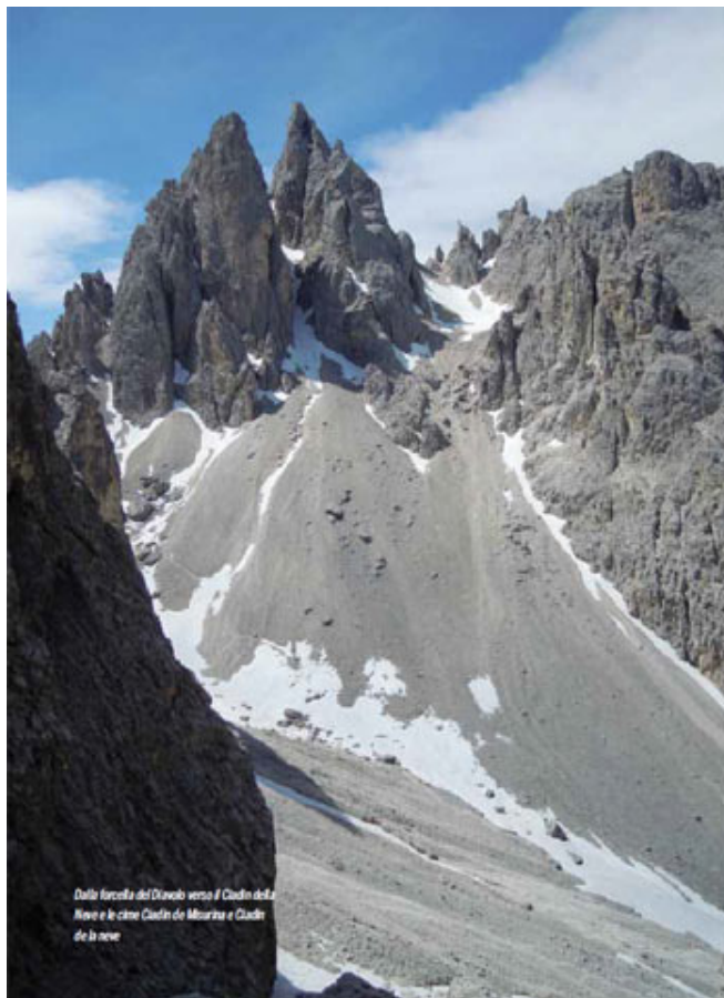
Dalla forcella del Diavolo verso il Cadin della Neve e le cime Cadin di Misurina e Cadin de la Neve